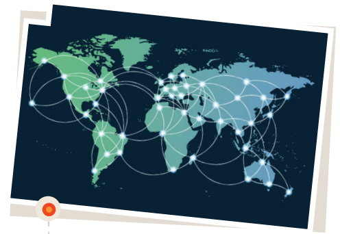
Nuestro planeta está interconectado a partir de la globalización.

Las personas con capacidades diferentes son consideradas como la “minoría más grande del mundo”. Según la Organización Mundial de la Salud (OMS), “en todo el mundo, las personas con discapacidad siguen enfrentándose a obstáculos en su participación en la sociedad, y a niveles inferiores de vida”. Por ello, en 2008, los Estados miembro de Naciones Unidas, en la Convención sobre los Derechos de las Personas con Discapacidad, lograron aprobar un tratado que “convierte a las personas con discapacidad en ‘tenedores de derechos’ y en ‘sujetos de derecho’, con la participación total en la formulación e implementación de planes y políticas que les afecten”. Para garantizar la equidad y el acceso igualitario a los derechos de todas las personas, es necesario que los distintos Estados desarrollen políticas tendientes a asegurarlos, pero también es necesaria una sociedad comprometida en el reconocimiento de la igualdad de derechos.