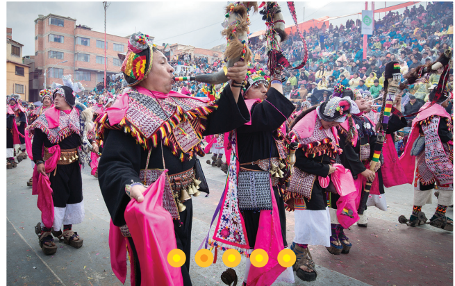
El Carnaval de Oruro es la máxima manifestación folklórica devocional de Bolivia y es considerado Patrimonio de la Humanidad.

En nuestro país, los segundos y terceros domingos de octubre, la comunidad boliviana en la Argentina festeja, en el barrio de Flores, en la Ciudad de Buenos Aires, la tradicional