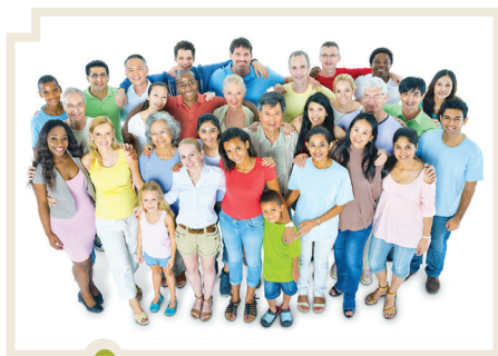
Dentro de la identidad colectiva, definimos nuestras características individuales.

Como latinoamericanos compartimos el hecho de vivir en un sector del planeta donde la desigualdad social y económica es de gran magnitud; donde nuestras comunidades originarias no acceden totalmente al goce de todos los derechos que las distintas constituciones les reconocen y deben luchar para que tengan cumplimiento efectivo; donde la pobreza de millones de personas es alarmante, y donde hay que recordar que la democracia es el gobierno del pueblo. Lamentablemente, también compartimos conflictos y problemas que afectan a diferentes grupos y sectores sociales. Analizaremos esto en las próximas páginas.