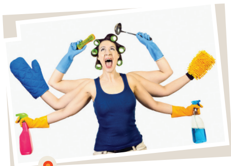
Representación hegemónica de género, hoy en día en transición.

Heterosexualidad: Atracción sexual que una persona siente hacia otra de sexo distinto al suyo.