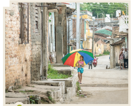
Un barrio muy humilde de La Habana, Cuba.

Según la CEPAL, América Latina es la región más desigual del mundo, debido a un reparto muy desigual de la riqueza. Para fines del año 2015, la CEPAL afirmó que el 29,2% de los latinoamericanos estaban bajo la línea de pobreza. Tengamos en cuenta que ese dato es regional. En Honduras, por ejemplo, la pobreza asciende a un 64,5%. Por lo tanto, ¿la corrupción será uno de los mayores problemas de América Latina, como afirma el estudio mencionado? ¿No será que la respuesta tiene mucho que ver con la gente que se decidió consultar para la encuesta?