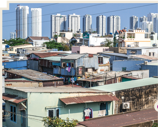
La pobreza y la riqueza. El contraste arquitectónico como muestra de la desigualdad social y económica.

Los Estados actuales se enfrentan hoy ante el desafío de promover políticas tendientes a disminuir esa desigualdad social y económica para garantizar el acceso de todas las personas a la educación, a una equidad de oportunidades, a una prevención sanitaria y médica, y a la obtención de un empleo que permita la cobertura de todas las necesidades. En suma, a una existencia en la que realmente todos seamos iguales ante la ley.