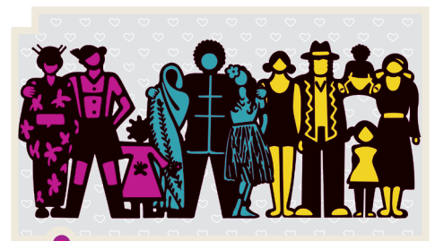
Esta ilustración representa la convivencia armoniosa en la diversidad cultural.

Las bases de la alteridad debemos buscarlas en los procesos de socialización, en el aprendizaje primario de los valores de la convivencia, la tolerancia y el respeto y preocupación por el otro. Para que haya alteridad, es necesario tener en cuenta la perspectiva del otro y ponerla en valor al mismo nivel que la propia. Si pensamos que la propia percepción de la realidad es la única posible y correcta, no solo no habilitamos el desarrollo de la alteridad, sino que también le estamos negando al otro su derecho de ser particular en el mundo.