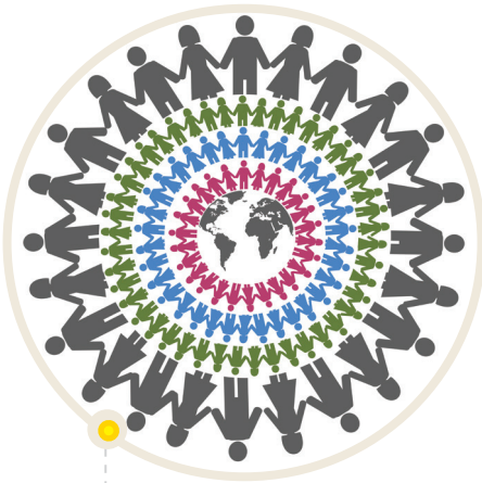
La sociedad y la cultura son lugares de diversidad.

En las páginas anteriores vimos que la sociedad, la cultura y la identidad son lugares de diversidad. Es justamente mediante esa diversidad que nos enriquecemos, porque nos contactamos con otras culturas y otras maneras posibles de entender el mundo en el que vivimos. Por lo tanto, en las sociedades en las que está presente la diversidad sociocultural, ningún grupo determinado debería perder parte de su cultura o de sus identidades en ese contacto, sino que esas diferencias deberían cobrar valor y espacio de desarrollo. En resumen, cada grupo tiene algo que brindar y aprender del otro.