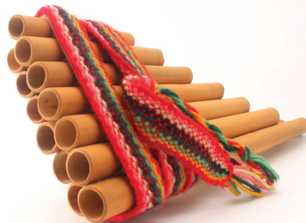
La antara es un instrumento típico del altiplano boliviano.

fiesta en honor a la Virgen de Copacabana. Cientos de personas se reúnen en una fiesta colmada de comidas típicas y de danzas acompañadas de música y trajes tradicionales, creando una atmósfera atemporal que nos abraza desde el pasado y nos recuerda nuestra identidad latinoamericana.