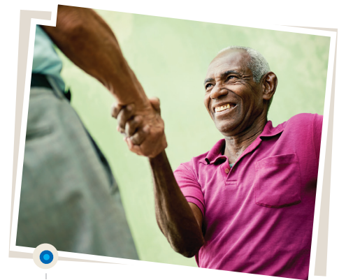
La alteridad propicia el diálogo y el entendimiento.

Para que haya alteridad, ese puente relacional producido entre el “otro” y “yo”, entre un “nosotros” y un “ellos”, se debe desarrollar en armonía y respeto. Esta división no significa ejercer algún tipo de práctica discriminatoria negativa, sino que se refiere a valorar y respetar las situaciones de encuentro de dos cosmovisiones o formas diferentes de concebir la realidad. La alteridad propicia el diálogo, el entendimiento y las relaciones pacíficas y armoniosas entre “nosotros” y los “otros”. Si no hay alteridad, aparece la discriminación y los intentos de dominación de aquel que se presume más fuerte o correcto. Por ejemplo, en el proceso de conquista y colonización de América, las culturas y cosmovisiones de las comunidades originarias eran vistas por los europeos como inferiores, atrasadas y “no civilizadas”. Esa concepción estaba basada en la creencia de que la cultura de “ellos”, la europea, era superior. En esa relación desigual, no hubo voluntad de entendimiento y respeto por la forma de comprensión del mundo que tenían los indígenas americanos, no hubo alteridad. Por lo tanto, la cultura europea dominó a la americana e impuso por la fuerza su propia manera de ser cultural.