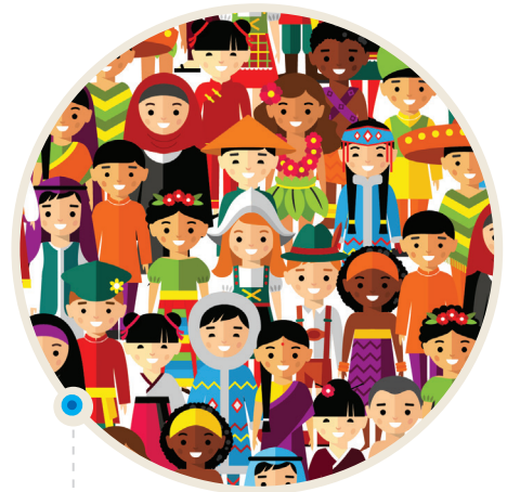
Diferentes etnias conviven en las sociedades multiculturales.

Globalización: Es un proceso histórico de integración mundial en los ámbitos político, económico, social, cultural y tecnológico, que ha convertido al mundo en un lugar cada vez más interconectado, en una aldea global.