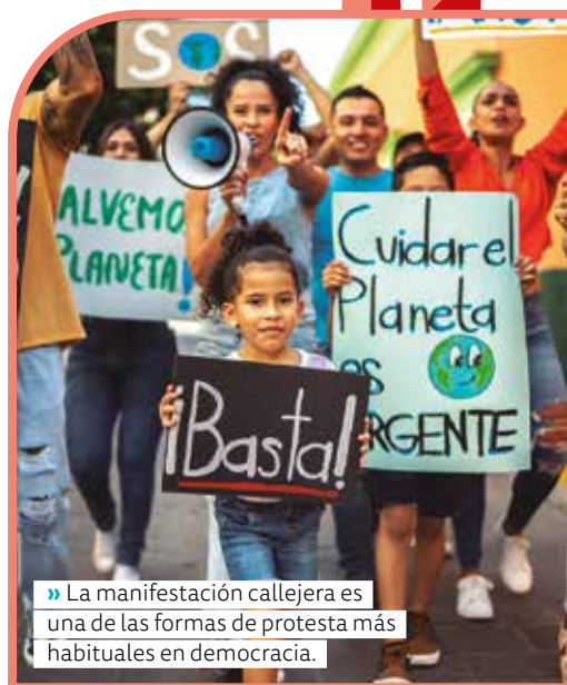
» La manifestación callejera es una de las formas de protesta más habituales en democracia.

Protestar es un derecho de todos los ciudadanos, siempre y cuando se realice de manera pacífica. Las maneras de protestar pueden ser muy variadas: manifestaciones, cortes momentáneos en la vía pública, campañas con afiches o en redes sociales, petitorios (juntar firmas en favor de un reclamo), entre otras.