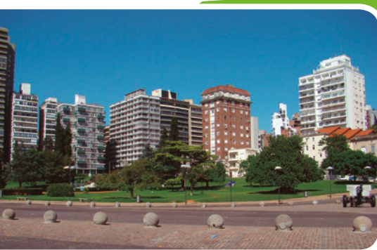
Rosario, en la provincia de Santa Fe, es una de las ciudades más pobladas del país.

El área metropolitana más poblada del país es el Gran Buenos Aires, que incluye a la Ciudad Autónoma de Buenos Aires y los 24 partidos de la provincia de Buenos Aires más cercanos a ella.