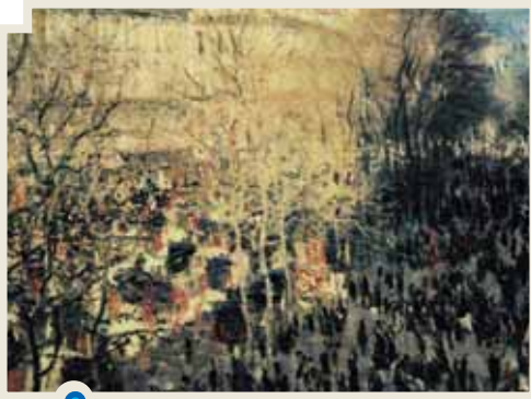
Carnaval en el Boulevard de los Capuchinos (1873) es una obra del pintor francés Claude Monet que refleja una festividad popular parisina que involucraba a todos los sectores sociales sin distinción.

Además, en el presente, la mayoría de los pensadores sociales considera que todo lo que nos rodea es parte de la Historia. Por ejemplo, si observan con detenimiento a su alrededor (la vía pública, su escuela o sus casas), descubrirán que siempre existen vestigios de las acciones de los seres humanos a través del tiempo. Todas las edificaciones, los medios de transporte, los utensilios que usamos para comer o para higienizarnos son el resultado del trabajo humano a través del tiempo. Analizar el conjunto de estos aspectos permite reconstruir el pasado, comprender el presente y reflexionar sobre los diferentes futuros posibles a construir.