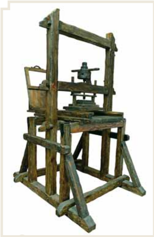
Réplica de una prensa de imprenta característica de la Modernidad.