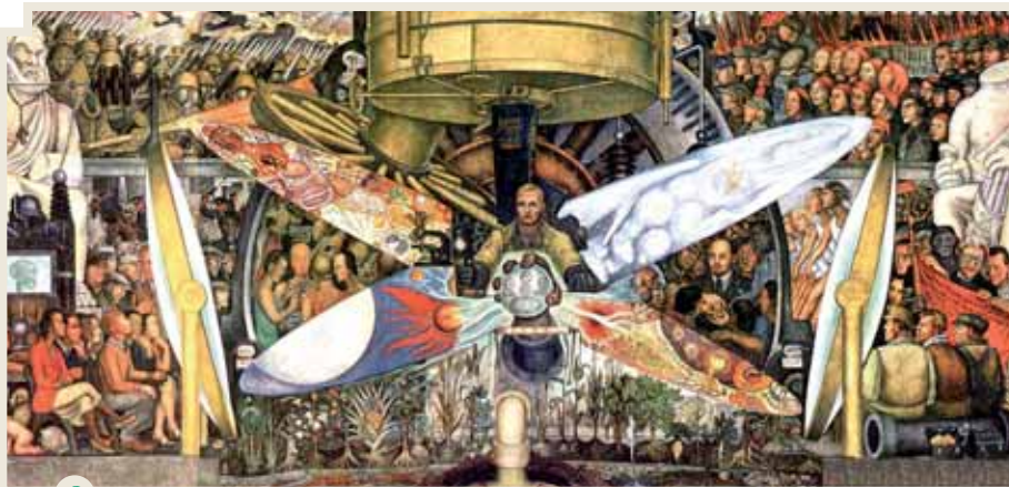
El hombre en la máquina del tiempo es un fresco realizado por el muralista mexicano Diego Rivera, en 1934. Esta obra refleja diversas transformaciones políticas, tecnológicas, sociales y económicas del mundo contemporáneo.

En rasgos generales, las sociedades tradicionales se caracterizan por una producción artesanal centrada en la familia, una economía de subsistencia rural, en la cual cada grupo consume lo que produce, y una organización estamental en la que no existe la movilidad social. Las sociedades modernas, en cambio, se distinguen por su carácter industrialista y urbano, su expansión comercial permanente y su marcado individualismo.