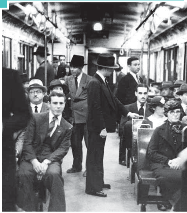
Vista interior de un coche del subte B de la ciudad de Buenos Aires en 1938.