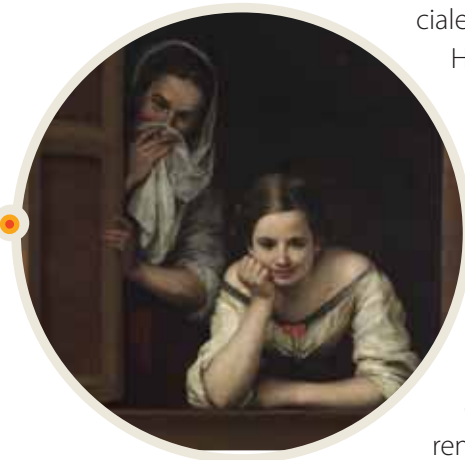
Dos mujeres en una ventana (1560) es óleo del artista español Bartolomé Murillo.