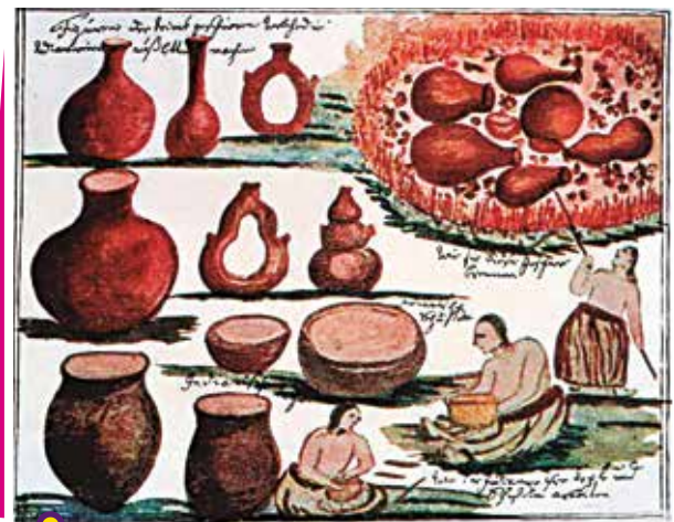
Actividades de los mocovíes, ilustradas por el sacerdote jesuita Florián Paucke en su obra Hacia allá y para acá (siglo XVIII).