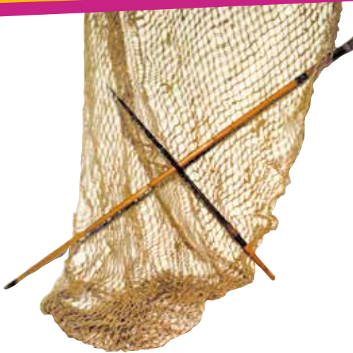
La red de pesca y el arpón eran herramientas cotidianas entre los pueblos pescadores.

Pueblos originarios del Chaco • Organización social • Actividades productivas • Costumbres y creencias