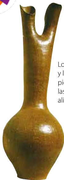
Los moqoit, los wichís y los pilagás fabricaban piezas de cerámica en las que almacenaban alimentos y agua fresca.