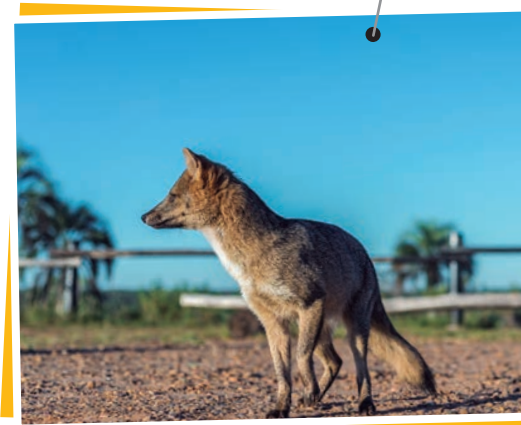
Zorro de las montañas.

Departamento: Nogoyá Superficie: 4.282 km 2 Población: 39.026 habitantes Densidad: 9,1 hab./km 2 Cabecera: Nogoyá