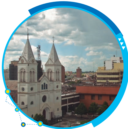
Vista de un sector céntrico de la ciudad de Concordia.

Departamento: Colón Superficie: 2.893 km 2 Población: 62.160 habitantes Densidad: 21,5 hab./km 2 Cabecera: Colón