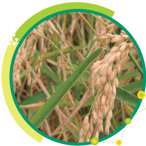
Cultivo de arroz.