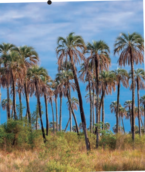
Parque Nacional El Palmar.

Como vimos, la provincia de Entre Ríos se divide en jurisdicciones menores llamadas departamentos. Cada uno ellos tiene una ciudad cabecera donde residen las autoridades departamentales. Además, cada departamento está compuesto por municipios que atienden las necesidades de las personas de cada lugar. A continuación, pueden ver datos interesantes de cada uno de los departamentos de nuestra provincia.