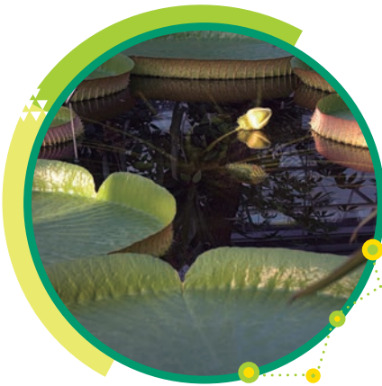
El irupé o Victoria cruziana es un planta acuática que se observa en las cuencas de los ríos Paraná y Paraguay.