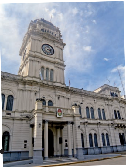
Casa de gobierno de la provincia de Entre Ríos.